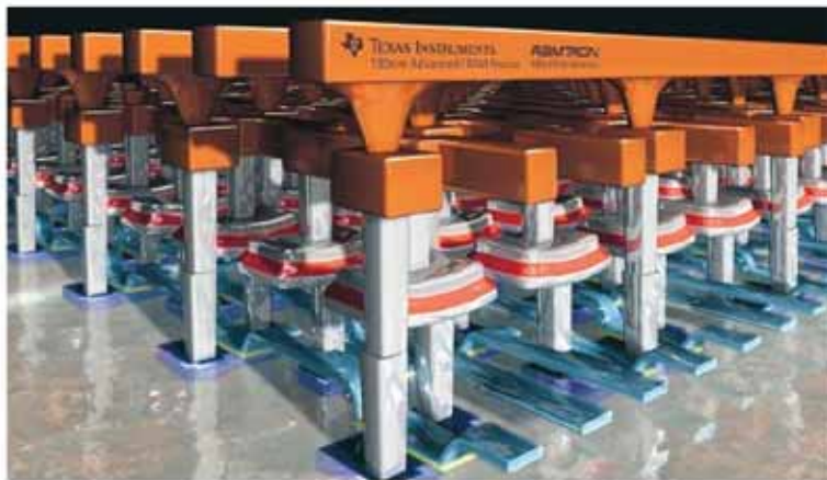
Fig 3. TIs beprövade 130 nm process är ett steg framåt för FRAM-teknologin.

likationer, även om detta snabbt håller på att förändras tack vare samarbetet med TI.