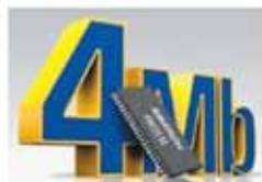
Fig 1. Ramtrons nya FRAM FM22L16 fyrdubblar minneskapaciteten till 4 Mbit.

För det första: Till skillnad mot andra ickeflyktiga minnen, som bygger på teknologier med flytande gate och som har långa fördröjningar vid skrivning, skriver FRAM med busshastighet. Det innebär att skrivoperationer sker med samma hastighet som läsoperationer. Därför behövs det inga fördröjningar när man vill att data skall lagras ickeflyktigt. Detta kan jämföras med EEPROM, där en skrivoperation kan få